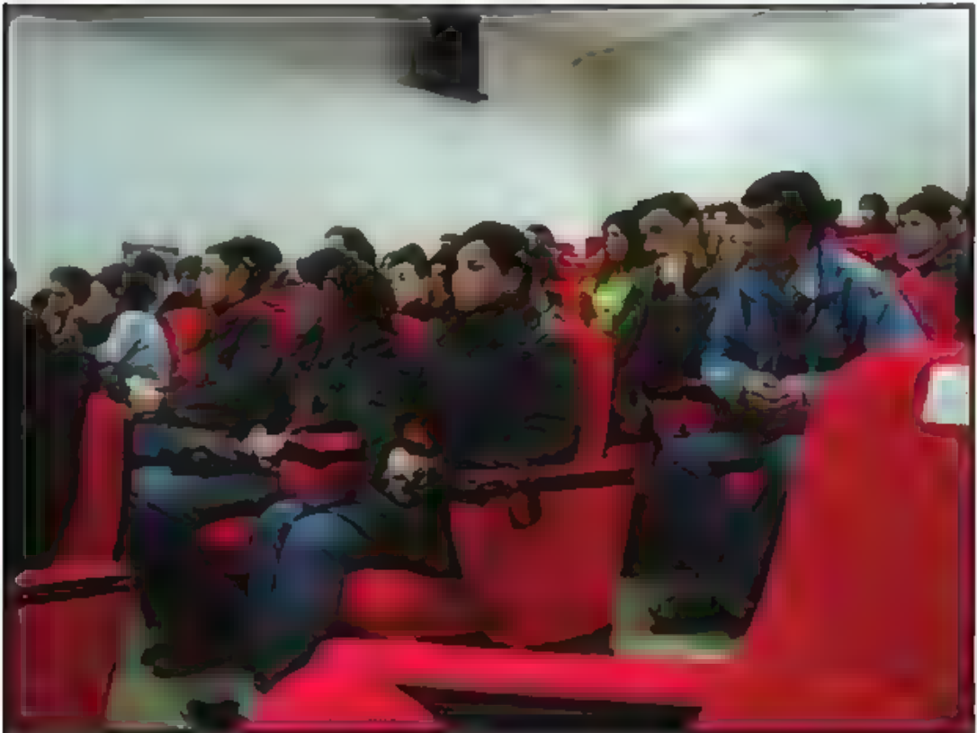
Konferansı İlgileyle Takip Eden Bir İzleyici Kitlesi Vardı